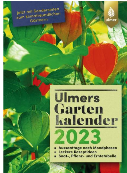
Ulmer's Gartenkalender 2023 12,00 EUR